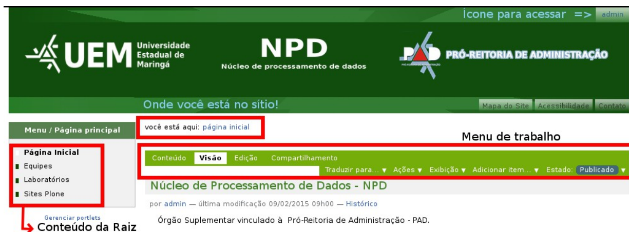
Figura 02 – Posição de campos importantes a serem verificados

No Plone, com a configuração utilizada na UEM, tudo colocado na raiz do sítio vai para o MENU. Em nossa comparação significa que tudo colocado dentro da pasta departamento vira um item do Menu. É importante sempre verificar onde se está no sítio! Existe abaixo do cabeçalho uma indicação: “Você está aqui: Página Inicial”, esta é a indicação de estar na raiz do sítio.